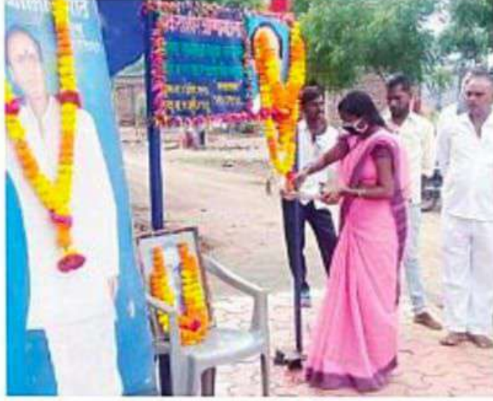
शहादा । प्रतिनिधी

महाराष्ट्र शासनाच्या सामाजिक न्याय व विशेष सहाय्य विभागाची स्वायत्त संस्था डॉ.बाबासाहेब आंबेडकर संशोधन व प्रशिक्षण संस्था बाटी पुणे अंतर्गत समतादुतांमार्फत नंदुरवार जिल्हयातील शाहादा तालुक्यात लोकशाहीर साहित्यरत्न अण्णाभाऊ साठे जन्मशताब्दी वर्ष कोरोना प्रादुर्भावामुळे झुमअॅपवर ऑनलाईन पद्धतीने साजरा करण्यात आला.